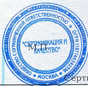
Схема сертификации: 3с.